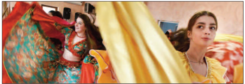
Children danced during the celebration of Family Day.