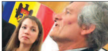
O masă rotundă guvern-deschis, mai stânga, și Miniștrii de finanțe din Olanda, de pe poza precum.