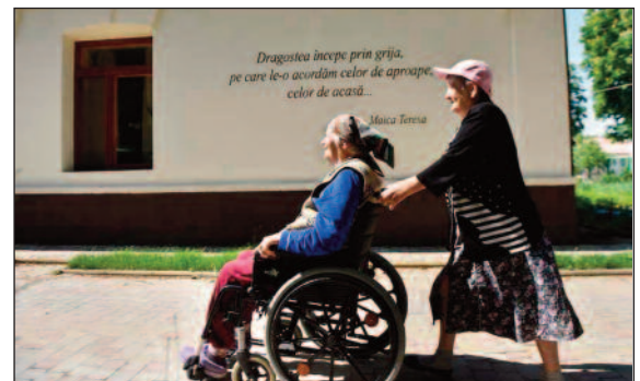
Castania residents go for a walk, and a roll. For more photos, click Here .

In Chisinau, I attended an event for the NovaTeca Maker-Space project. Our children's library in Rîșcani received a 2,000-piece Lego set that children can use to be creative and hone group skills.