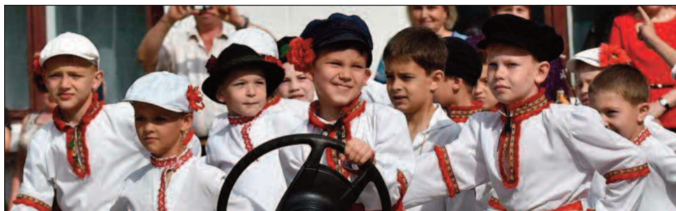
Copiii dansează tradițional la balul de absolvire în Școala rusă din Rîșcani.

Atunci când voi termina vor fi mii de fotografii din raionul Rîșcani, care pot fi utilizate de către Consiliu Raional, sate, întreprinderi sau oameni, pentru marketing, turism, programe sau proiecte.