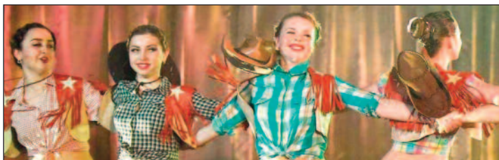
Elevii dansează la un cântec popular american în luna mai.

Dansul văzut aici se compară cu activitatea multor profesioniști din Statele Unite ale Americii, și eu sunt mândru pentru a arăta prietenilor mei acasă talentele prietenilor mei din Moldova.