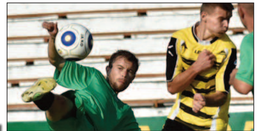
Jucătorii din Vărătic lovește mingea contra celui din Costești. Mai jos, un fan noroc jucători.