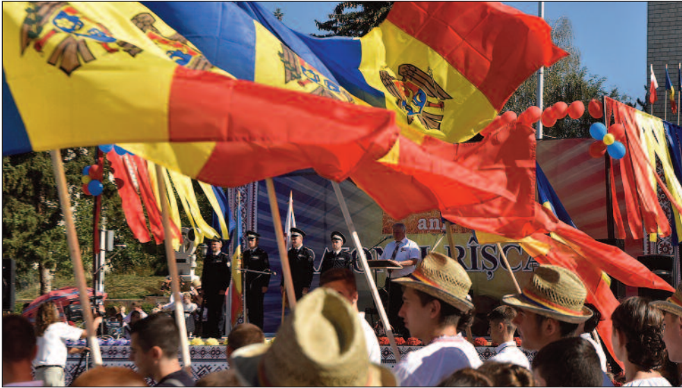
Moldovenii sărbătoresc un sfert de secol de independență 27 august în Rîșcani.