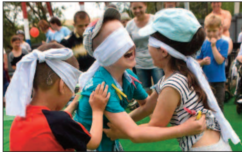
Copiii se joacă în timpul deschiderii unui loc de joacă pentru acces la Centrul Phoenix.

Facilitatea modernă este adaptată persoanelor cu dizabilități, cu un loc de joacă pentru acces și băi, precum și cea mai lungă rampa de scaune cu rotile și cel mai nou