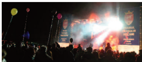
La mulți ani, Rîșcani!

Rîșcani a sărbătorit Hramul său la 21 septembrie, cu evenimente pe parcursul zilei. A început cu curse de biciclete pentru copii, iar apoi șoul cu motocicletele în centru. Festivitățile s-au încheiat cu un concert frumos și spectacol splendid cu focuri de artificii.