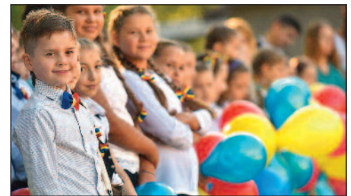
La liceul Liviu Damian.

Acestea sunt zile foarte speciale, cind elevii se îmbracă în haine frumoase, aduc flori pentru profesorii lor, și de a se aduna dimineața devreme pentru o celebrare a educației, cu cântec, dans și ... anunțuri!