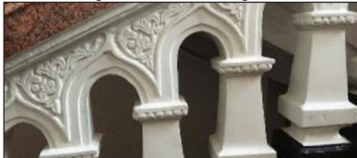
O balustradă de beton frumoasă, ornată și durabilă la stația de tren din Chișinău.