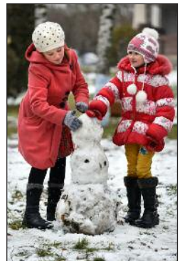
Fetele au construit un om de zăpadă la Casa de Cultura după prima ninsoare din 2016.