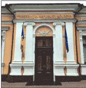
Clădirea prezidențială din Chișinău, realizată din beton.

Condițiile de viață în beton a construit un caracter puternic la poporul moldovenesc. În comparație cu America, foarte puține case sunt modificate sau demolate și reconstruite creând mult mai puține deșeurii și o atitudine sănătoasă de a fi mulțumit cu ceea ce ai.