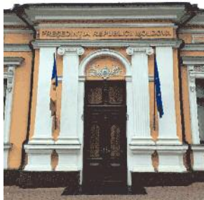
Президентское здание в Кишинёве, из бетона.

Жизнь в бетоне сформировала сильный характер у молдавского народа. По сравнению с Америкой, очень мало домов были изменены, или снесены и перестроены, создавая гораздо меньше отходов и здоровое отношение довольствоваться тем, что есть.