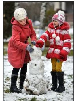
Девочки слепили снеговика около Дома Культуры Рышкань, после первого снегопада в 2016 году.

так как многие люди обвиняют ее партию в краже. Американцы избрали Дональда Трампа на пост президента, вторым кандидатом была бывшая первая леди, сенатор, и госсекретарь Хиллари Клинтон. Президент США не избирается всеобщим голосованием (так бы Клинтон выиграла), а числом "выборщиков", которые проходят на выборы в каждом из 50 штатов.