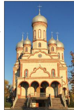
An Orthodox church in Drochia, Moldova.