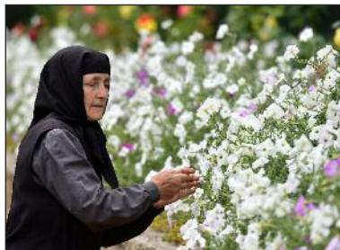
O călugăriță se îngrijește de flori la Mănăstirea Rudi din Soroca.

Două lucruri separă Creștinii Ortodocși de religiile de vest: primul lucru- Biblia este aproape la fel, dar traducerea testamentului vechi la Creștin ortodocși este