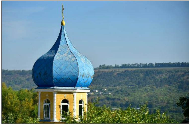
O cupolă deasupra mănăstirii din Călărășeuca din nord-estul Moldovei.

Moldovenii sunt religioși în continuare în pofida interzicerii comuniste pe parcursul a cinci decenii.