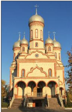
В Дроики, Молдова.

славие из западных религий; Во-первых, они читают ту же самую Библию, но Ветхого Завета, основанную на еврейском переводе.