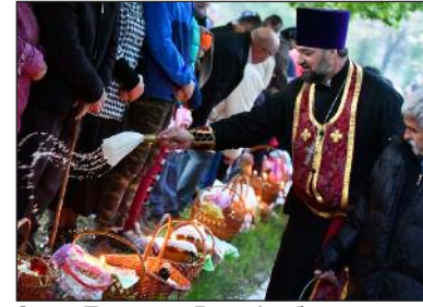
Отец Теодора Bazatin благословляет корзины еды Пасха.

Многие питьевые колодцы в каждой деревне и городе украшены.