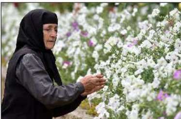
Монахиня в монастыре Rudi в Сококах.

славие из западных религий; Во-первых, они читают ту же самую Библию, но Ветхого Завета, основанную на еврейском переводе.