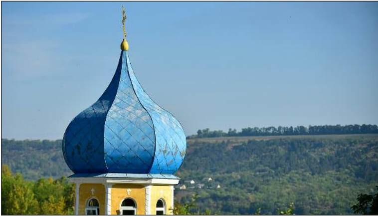
Монастырь в Каларашовка.

Религию под запретом в течение пяти десятилетий во время советской оккупации.