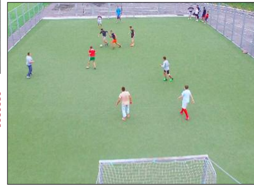
Joacă fotbal la stadionul din Rîșcani.

La mulți ani la tine, la mulți ani pentru tine, La mulți ani dragă (Nume), La mulți ani pentru tine! (Happy Birthday to You, Happy Birthday to You, Happy Birthday dear (Name), Happy Birthday to You!)