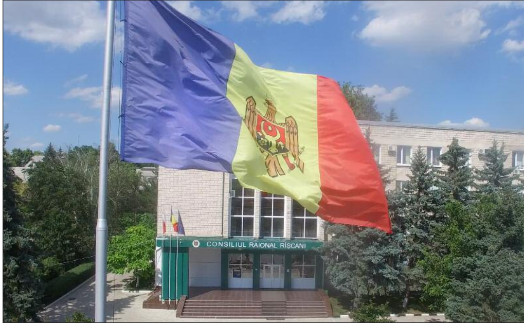
Steagul național al Moldovei în fața birourilor raionale Rîșcani din orașul Rîșcani.