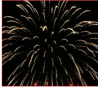
Focuri de artificii deasupra orașului Rîșcani pentru ziua de naștere a orașului la 21 septembrie 2016.

Oamenii din ambele țări își zboară steagurile la jumătate de catarg când