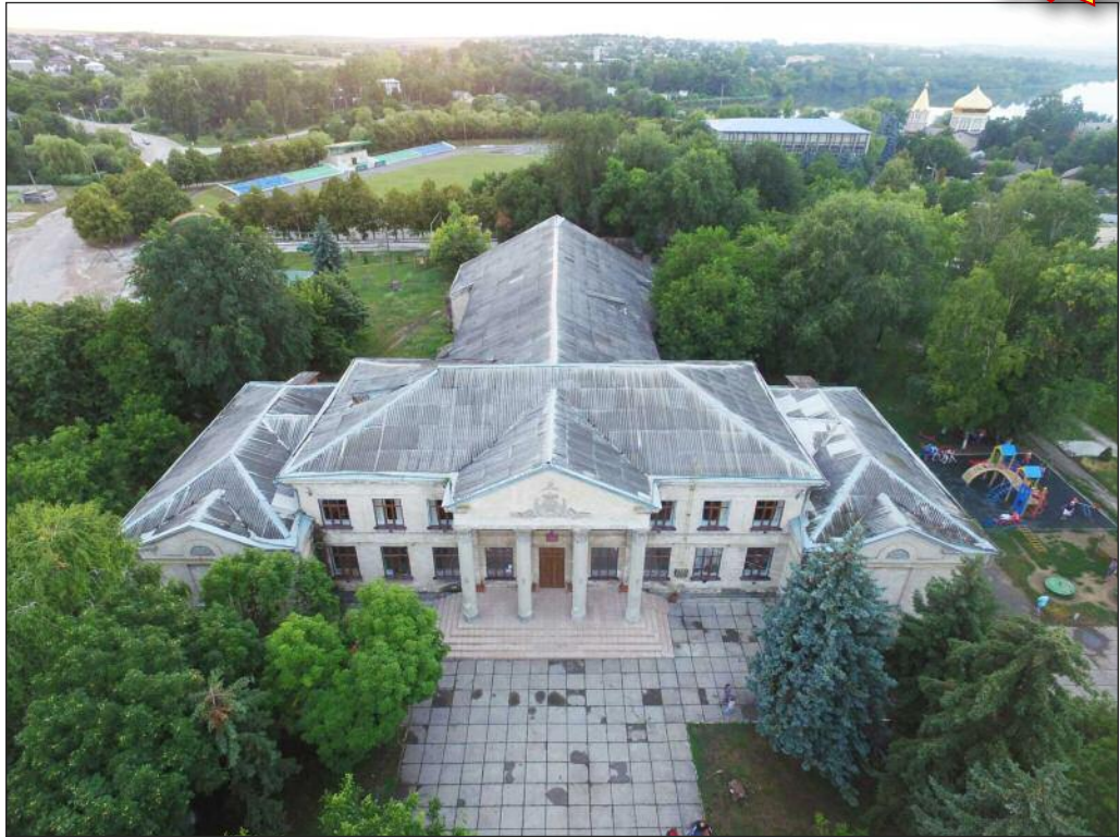
Peisaj al casei de cultură Rîșcani, care nu a fost văzută niciodată. Clădirea găzduiește un teatru de 600 de locuri cu scenă, o bibliotecă, un laborator de calculatoare, o sală de muzică și birouri. În spatele clădirii, din stânga, se află stadionul de fotbal al orașului, sala de baschet, biserica ortodoxă și lac.

Jurnaliștii instruiți cunosc legile guvernelor deschise și lucrează zilnic pentru a fi "ochii și urechile". Prin raportarea corectă și viguroasă, guvernele sunt responsabile de modul în care cheltuiesc banii contribuabililor și ajută companiile să respecte modul în care tratează angajații și publicul.